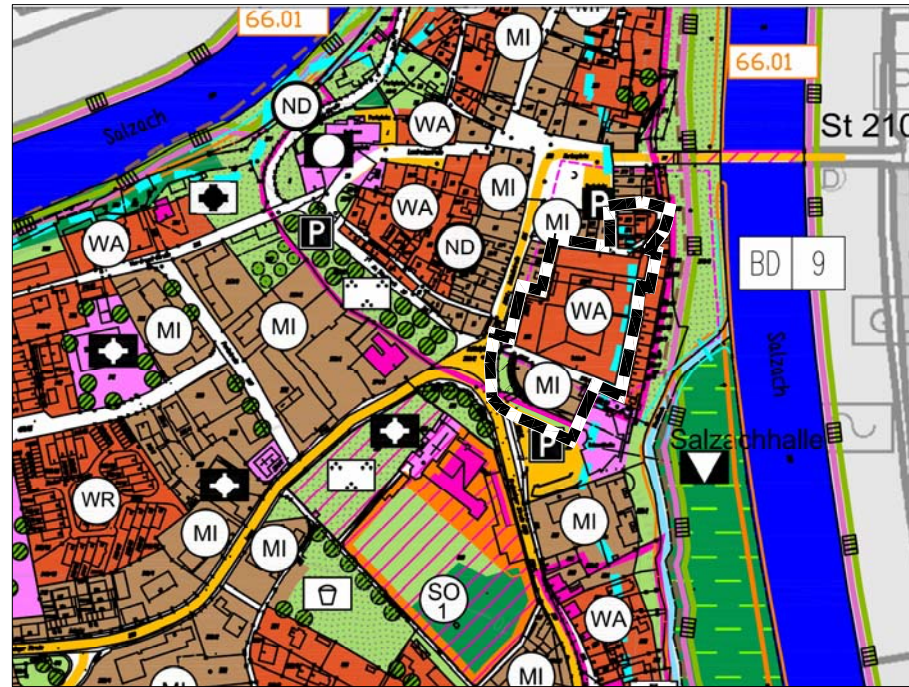
Rechtskräftiger Flächennutzungsplan vom 30.11.2010